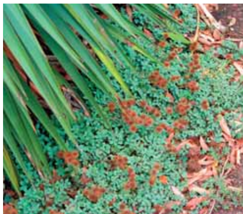
Ježica je odlična blazinasto pokrovnna rastlina z lepimi listi, ki hitro prerastejo tla. Sadimo jo lahko tudi med plošče ali tlakovce.