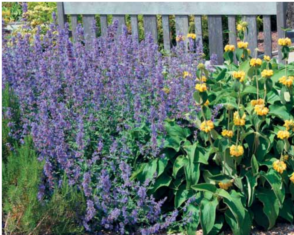
Flomis (desno) na gredi v družbi mačje mete