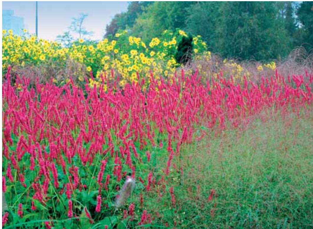
Helianthus 'Lemon Queen' je priljubljena visoka trajnica, ki raste pokončno tudi brez opore. Na fotografiji v ozadju grede, pred njo sta dresen in okrasne trave.