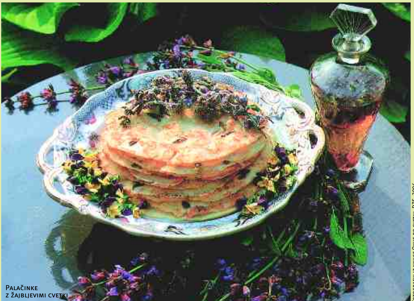
PALAČINKE Z ŽAJBLJEVIMI CVETKI