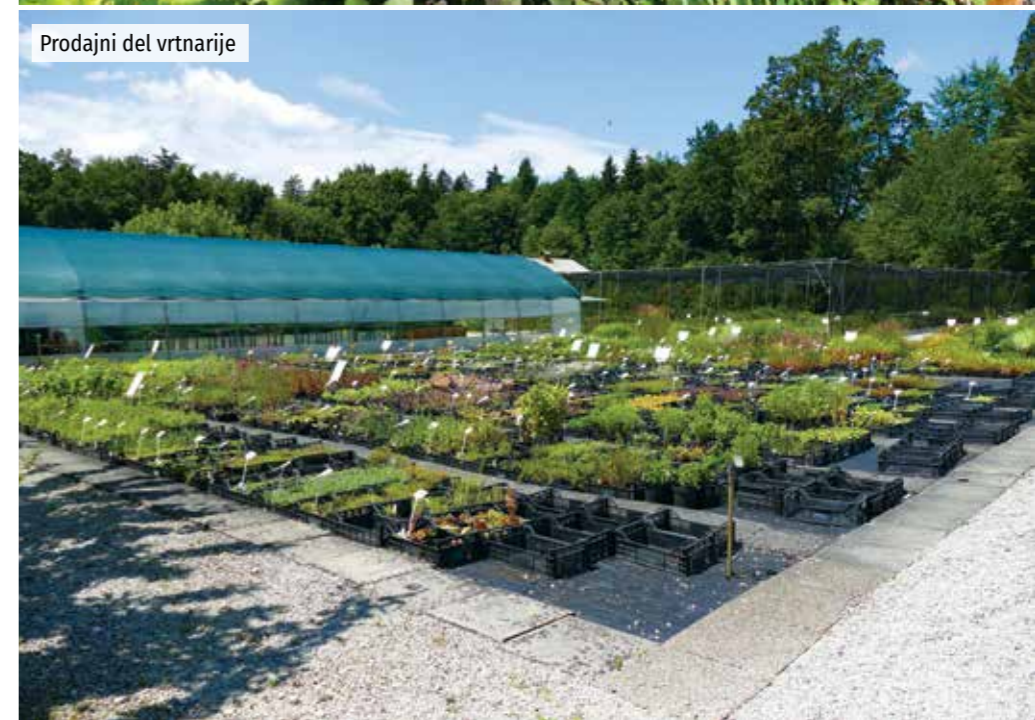
Prodajni del vrtnarije