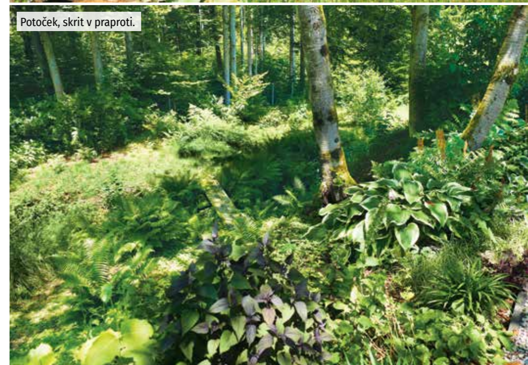
Potoček, skrit v praproti.