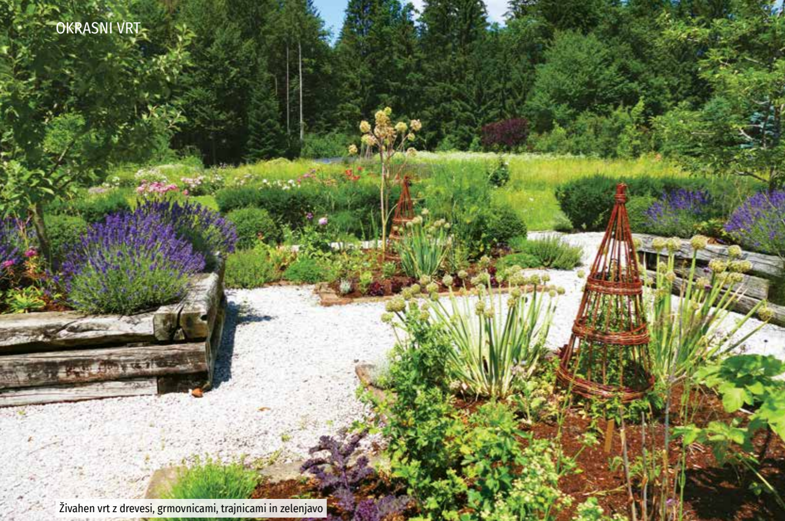
Živahen vrt z drevesi, grmovnicami, trajnicami in zelenjavo