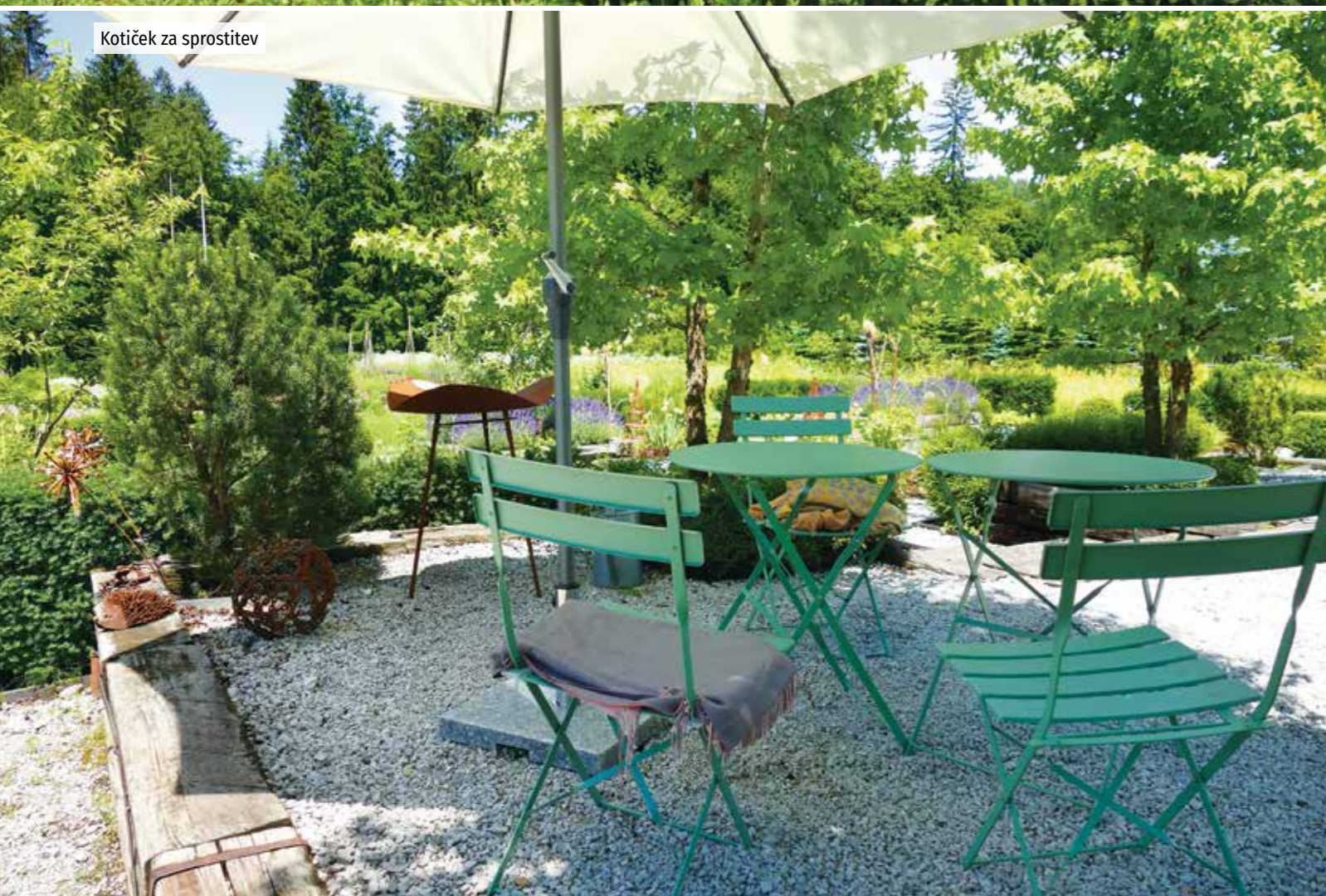
Kotiček za sprostitev