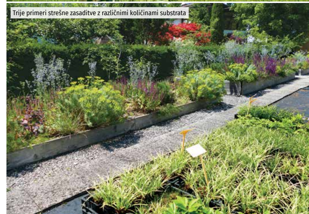
Trije primeri strešne zasaditve z različnimi količinami substrata