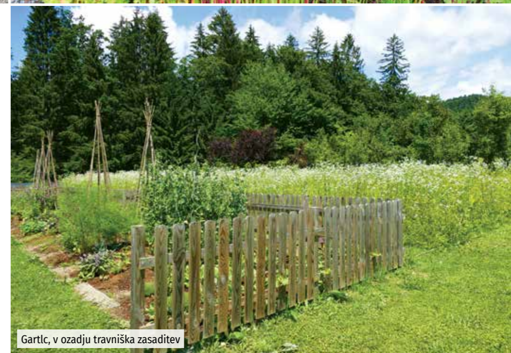
Gartlc, v ozadju travniška zasaditev

Vrnila se je v Črnuče in si ustvarila dobro ekipo sodelavcev, s katerimi se posveča oblikovanju zelenih površin in vrtov. Na Črnuški gmajni, tik pred gozdom ima vrtnarijo s trajnicami, zraven pa še park – primere zasaditev – otoke biotske raznovrstnosti. Začne se s parkirnim prostorom, katerega rob je zasajen s tajnicami in grmovnicami, ki rastejo v senci velikih dreves. Pisarniški prostor ima na strehi bogato trajno zasaditev na 15 cm substrata, zato vse skupaj ne predstavlja velike obremenitve za streho. Predstavlja pa dobro toplotno izolacijo in raj za ptice in insekte. Ob pisarni so pod ameriški ambrovci miza in stoli s pogledom na zanimivo zasaditev, kjer sta dvignjena osrednja dela zasajena s